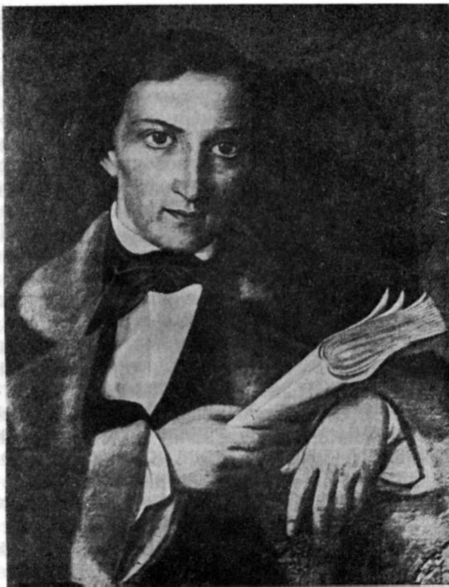
К. Д. Ушинский в 1841—1850 гг.

что на место уволенного из университета проф. Редкина поступил новый профессор, которого «прислали не для ученых, а более для политических целей. Он на первой лекции развивал ту мысль, что монархическое неограниченное правление есть идеал, к которому стремится все человечество с начала исторического периода». И далее автор обращается мыслью опять к Ушинскому. «Ярославцы давно уже уехали. С Ушинским я сошелся как нельзя больше. Чудная натура! Несмотря на свою странность, он мне напоминает Кароля (что касается до недостатков). Но он их выкупает своей жизненаполненностью и детской чистотой души. Если бы я был женщина, я бы в него влюбился без ума». Кароль, с которым Павлов сравнивает Ушинского, — действующее лицо в романе Бальзака «Музей древностей». «Кароли, — поясняет Бальзак, — никогда не склоняли головы перед королевской властью, ни перед городами, ни перед церковью, ни перед богатством». Герой романа — разорившийся в период французской революции дворянин, лишившийся всех своих земельных богатств, но не эмигрировавший за границу: «Благодаря