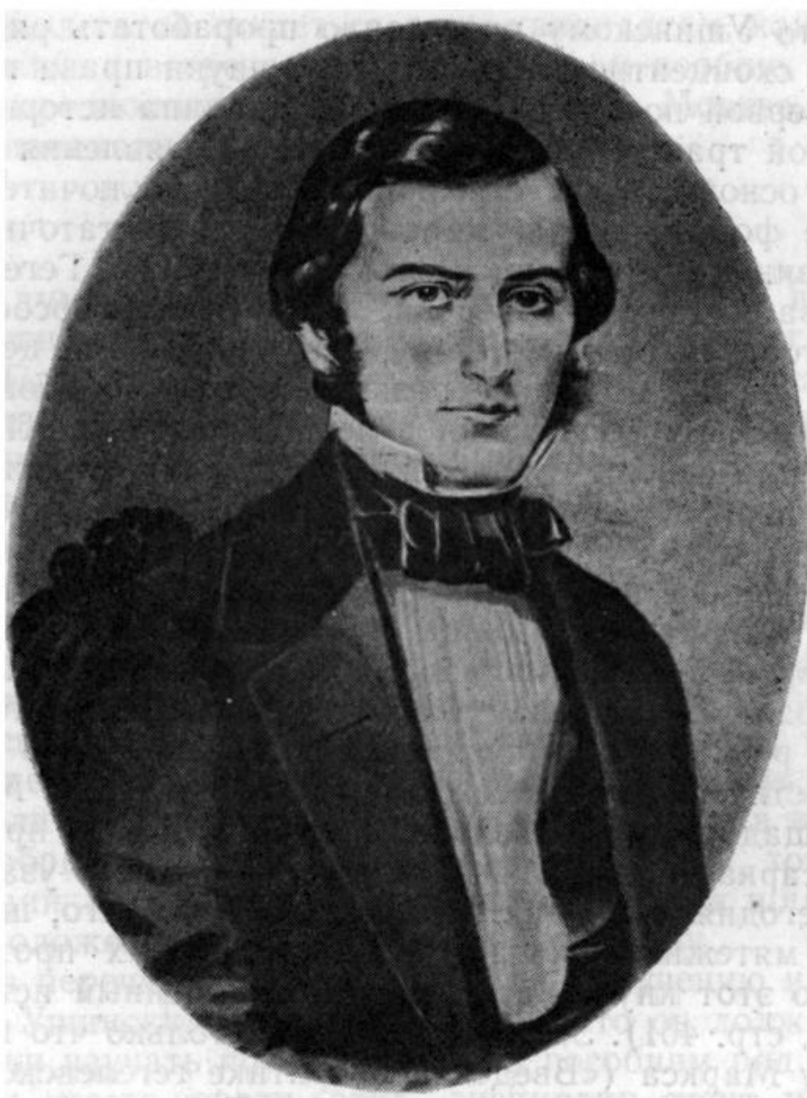
К. Д. Ушинский в 1844—1845 гг.

Если спросить теперь, как шли занятия Ушинского по изложенной программе, то чтение дневника оставляет впечатление, что, изучая перечисленные работы, он сразу же столкнулся с двумя возможностями, которые непримиримо боролись в нем на протяжении всего времени, пока шла подготовка к экзамену. Первая возможность, сразу увлекшая Ушинского и сообщившая особую привлекательность его занятиям,— это возможность творческой работы над изучаемым материалом и выяснением в связи с этим своего призвания в жизни; вторая возможность, сразу же воспринятая Ушинским угнетенно и отрицательно, это перспектива формального усвоения предметов и сдачи экзамена с официальным заявлением, что он стремится к получению магистерской степени.