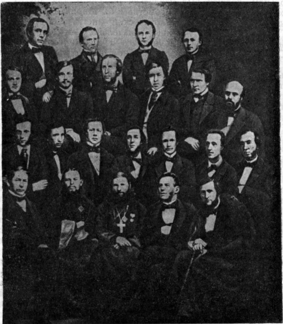
К. Д. Ушинский среди сотрудников Смольного 1861—1862 гг.