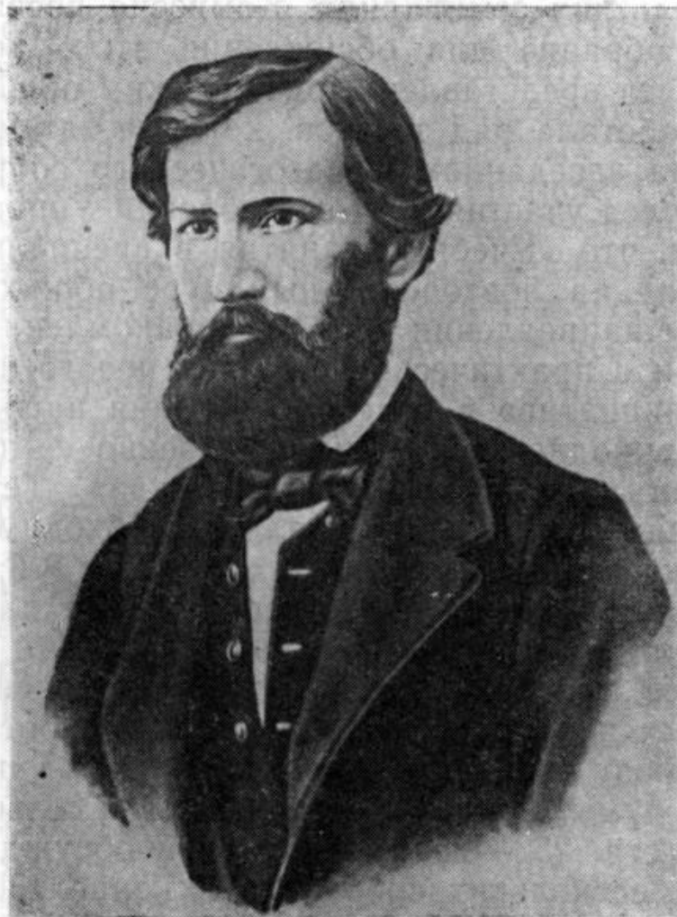
К. Д. Ушинский в 1864 г.