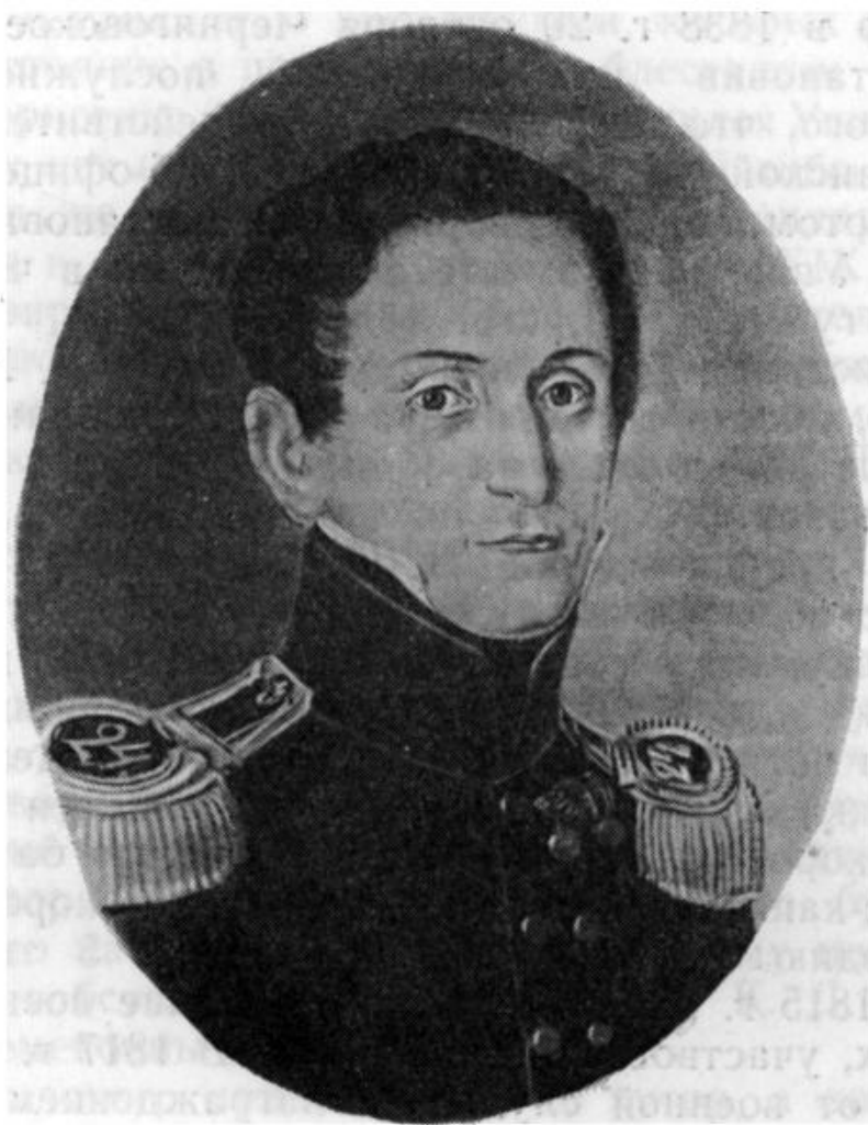
Отец К. Д. Ушинского

стр. 242—243). Только после этого отец Ушинского возвращается на постоянное жительство в Новгород-Северск, подает заявление о включении его в дворянскую родословную книгу Черниговской губернии и в 1840 г. избирается дворянами на ответственную должность уездного судьи. М. Чалый, товарищ по гимназии, утверждает, что мать К. Д. Ушинского — Любовь Степановна — происходила из семьи местного капиталиста, по фамилии Гусак, почему и мать Ушинского в бытовом, обиходном разговоре называли Гусаковной (М. Чалый, Материалы для биографии Ушинского. «Нар. шк.», 1874 г., № 4, стр. 45). Ю. С. Рехневский сообщает в некрологе об Ушинском: «Мать его была урожденная Гусак» (Соч. Ушинского, т. XI, стр. 404). Другие авторы вносят сюда уточнения, говоря, что Д. Г. Ушинский вступил в брак с дочерью местного капиталиста, урожденной Капнист (М. Песковский, К. Д. Ушинский, стр. 9, то же в воспоминаниях А. Старчевского). В документе о сопричислении Д. Г. Ушинского с законными его детьми к дворянскому сословию отмечено, что после смерти жены его (т. е. в 1835 г.) ему достались крестьяне в хуторах Солоном и Павловском с жилым домом в Новгород-Северске. Таким образом, землю с крестьянами в означенных двух хуторах и дом на окраине Новгород-Север-