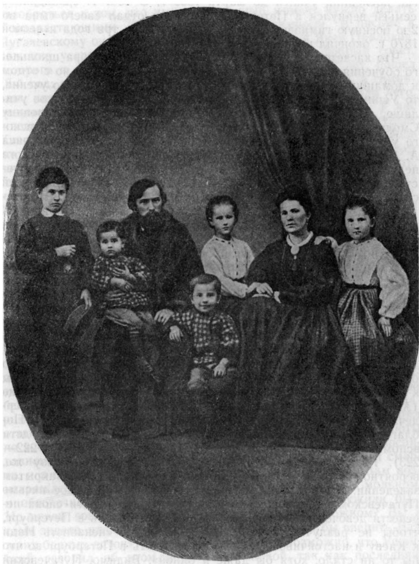
К. Д. Ушинский с семьей в 1864 г.