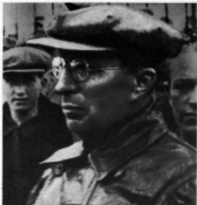
А. С. Макаренко, 30-е гг.

Фотография А. М. Горького, подаренная А. С. Макаренко.