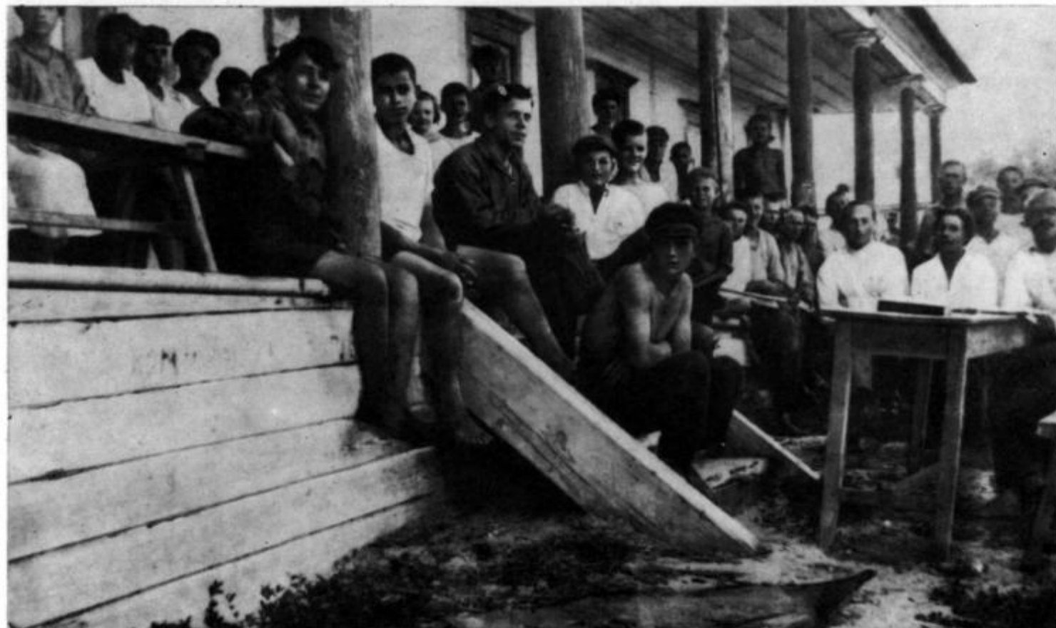
Совет командиров колонии, группа воспитателей-учителей (примерно 1926 г.).