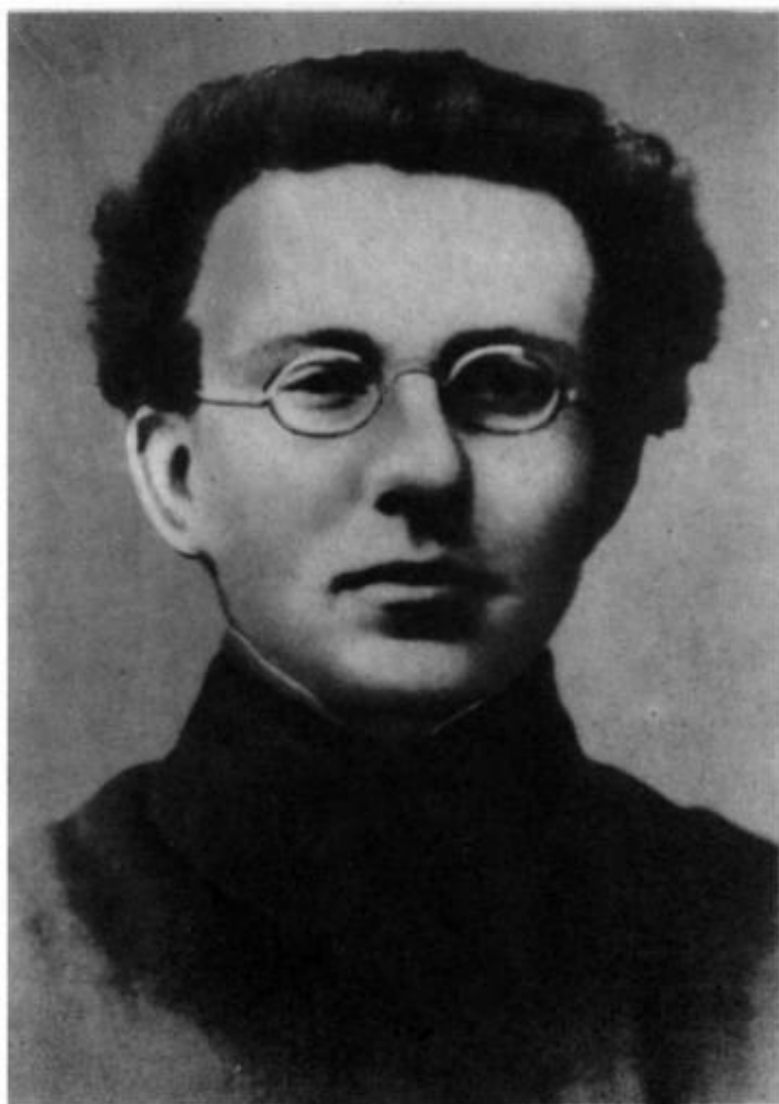
А. С. Макаренко в первые годы учительства в дореволюционной школе.