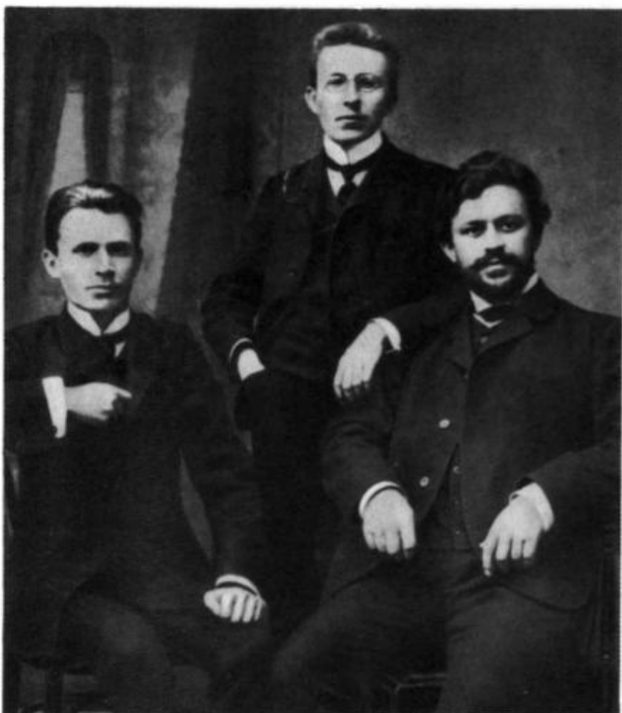
А. С. Макаренко и преподаватели Крюковского железнодорожного училища.