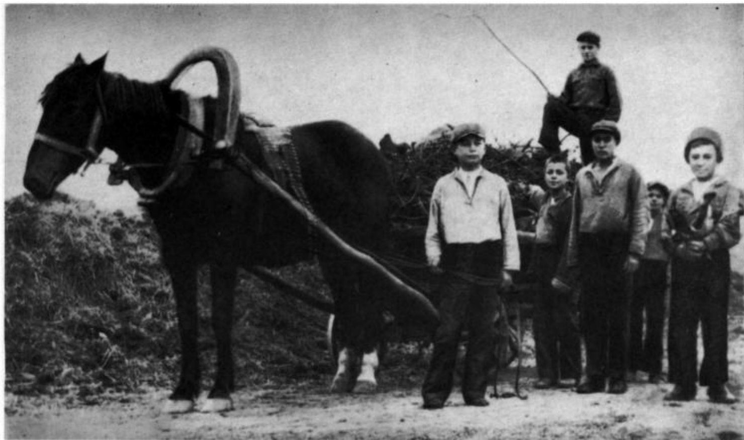
Воспитанники детской трудовой колонии им. М. Горького на работе (начало 20-х гг.).