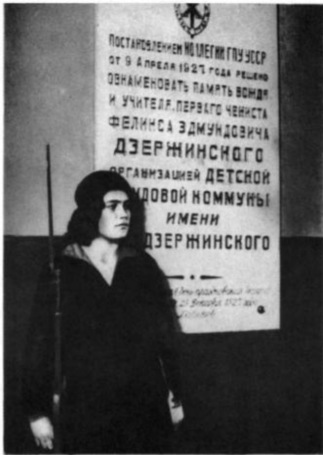
Пост коммунаров у мемориальной доски в вестибюле «главного» здания коммунуны.