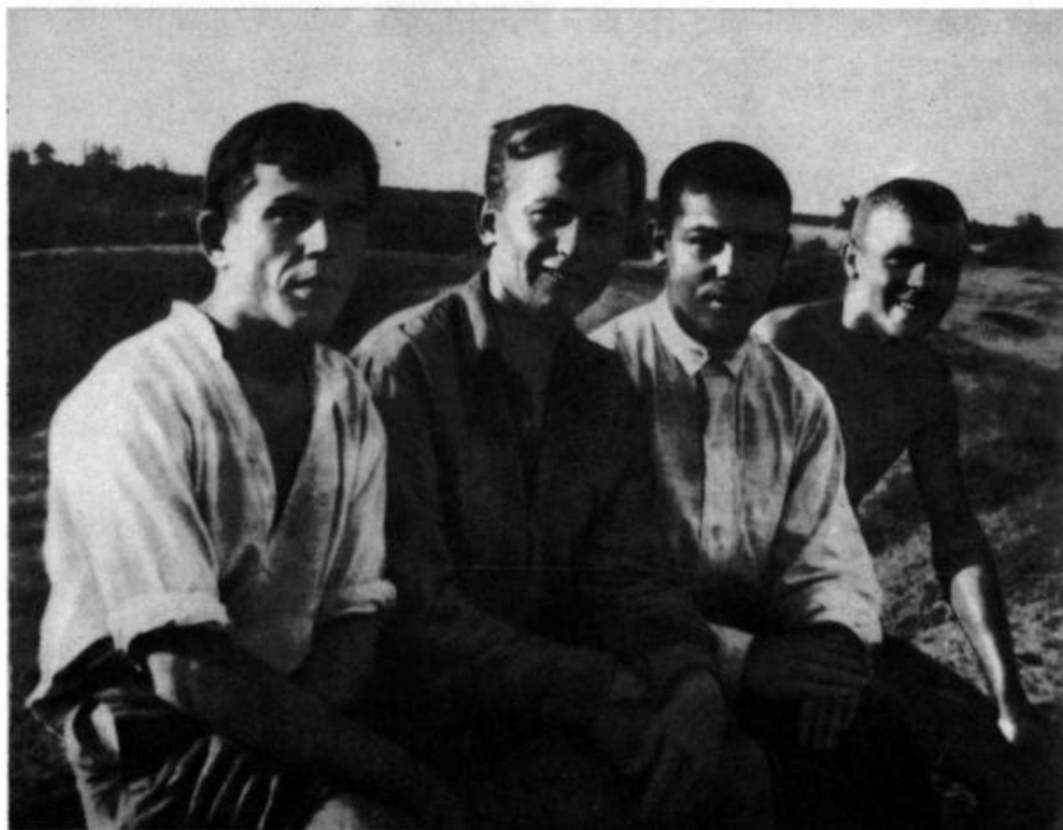
Горьковцы-студенты (1927 или 1928 г.).