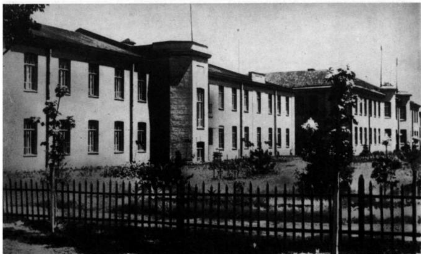
«Главное» здание детской трудовой коммунуны им. Ф. Э. Дзержинского.