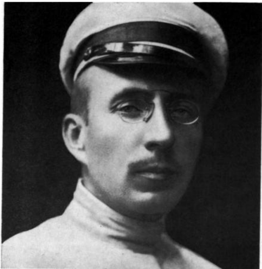
А. С. Макаренко, 1920 г.