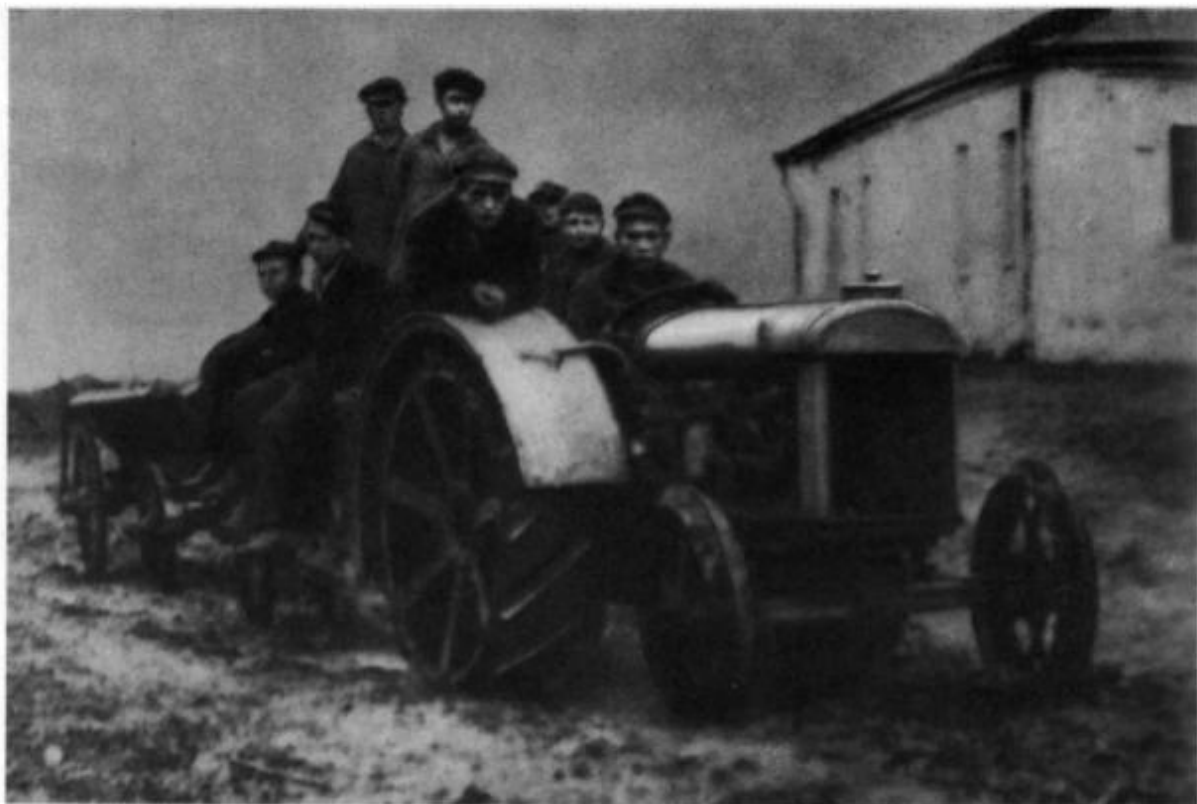
Первый трактор в колонии им. М. Горького (примерно 1926 г.).